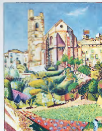
Joan Miró. Mont Roig del Camp, church and village, 1919. Oil on canvas. Private collection