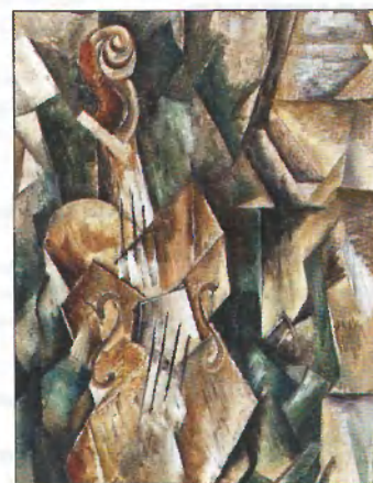
Жорж Брак. Скрипка и палитра. Живопись, 1909. Холст, масло, 92×43 см. Музей Соломона Гуггенхайма, Нью-Йорк