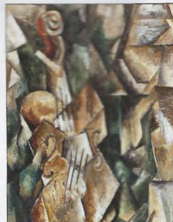
Georges Braque. Violin and palette. Painting, 1909. Oil on canvas, 92×43 cm. Solomon Guggenheim Museum, New York