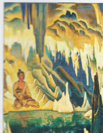
Nicholas Roerich. Buddha the Winner. 1925. Tempera on canvas, 742×1177 cm. International Center-Museum, N.K. Roerich, Moscow