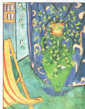
Анри Матисс. Угол мастерской художника. 1912. Холст, масло. 191.5×114 см. Частная коллекция