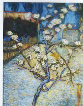
Vincent Van Gogh, Blossoming pear tree, 1888. Oil on canvas, 73x46 cm. Vincent Van Gogh Museum, Amsterdam