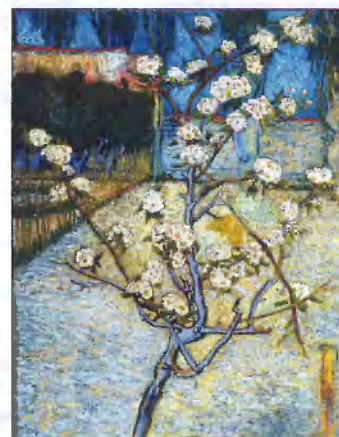
Винсент Ван Гог. Цветущее дерево груши. 1888. Холст, масло, 73×46 см. Музей Винсента Ван Гога, Амстердам