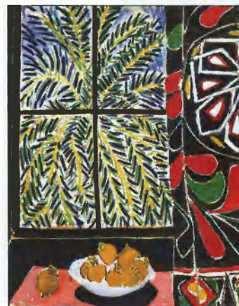
Анри Матисс. Интерьер с египетской занавеской. 1948 Холст, масло, 116,2×89,2 см. Собрание Филлипса, Вашингтон