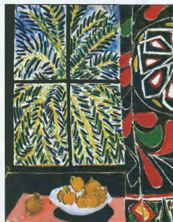
Henri Matisse. Interior with Egyptian curtain. 1948 Oil on canvas, 116.2×89.2 cm. Collection Phillips, Washington