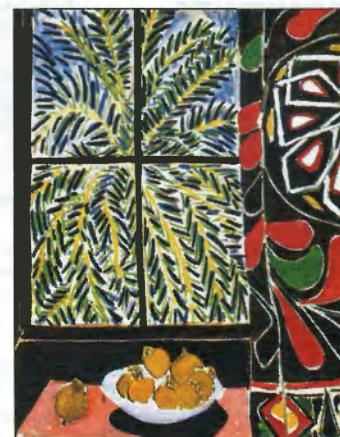
Анри Матисс. Интерьер с египетской занавеской. 1948 Холст, масло, 116,2×89,2 см. Собрание Филлипса, Вашингтон